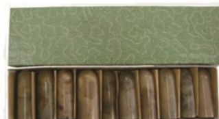
▲自然彩凍章 (10本錦盒入)