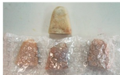
▲自然彩凍章 (3本ビニールパック)